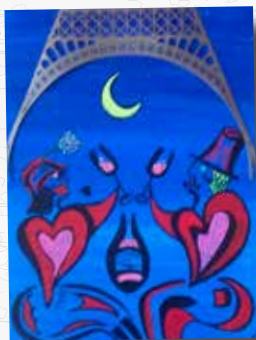
« Les amoureux de Paris trinquent sous la tour Eiffel »

Du 10 au 30 septembre exposition de tableau à la bibliothèque par un artiste libre autodidacte.