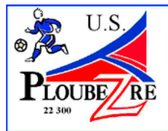
Le Logo identifiant le club