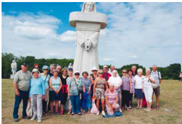
La broderie Mars 2018