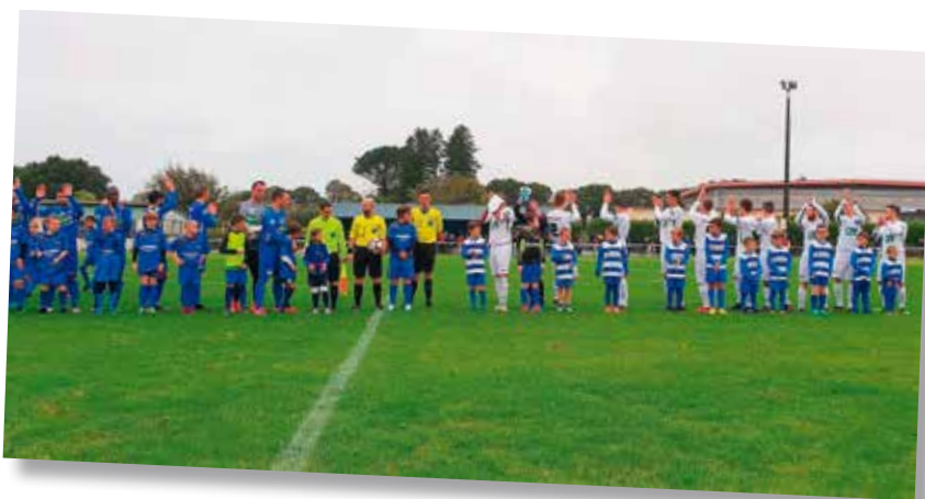
USP - Guipavas, coupe de France