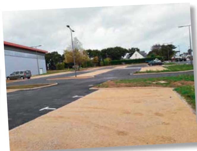
Parking André Paugam