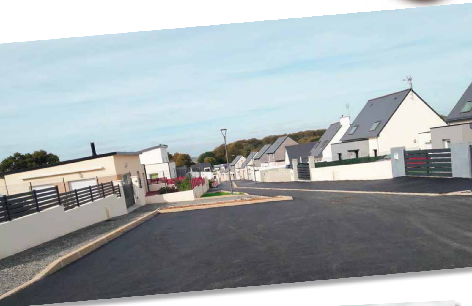
Rue François Le Guillou