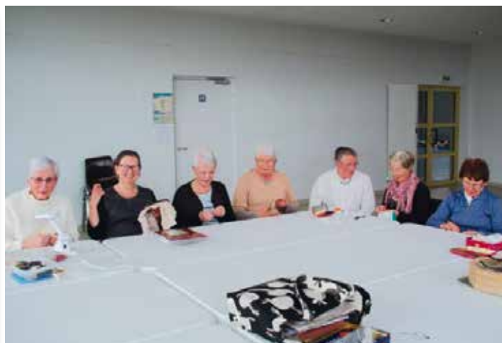
Carnoët Sept 2018