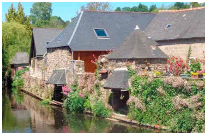
Pontrieux les lavoirs