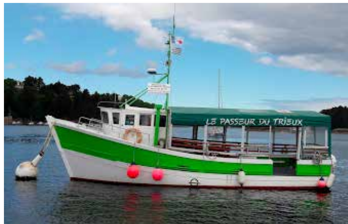
Le passeur du Trieux

- Avec Min Ran l'année se termine ou recommence ou les deux, par une marche, excursion.... plutôt locale, cette fois-ci nous sommes 31 participants, nous avons opté pour une balade le samedi 31 août sur le Trieux, direction Lézardrieux et retour par le car du « Passeur du Trieux » ; arrivés à Pontrieux point de débarquement, suivant les choix de chacun, un groupe ira pique-niquer l'autre qui aura préféré le restaurant, sera au débarquement presque face à celui-ci. On profitera dans l'après midi via le Trieux de faire une visite nautique des lavoirs de cette charmante cité.