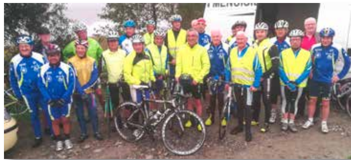
La sortie masculine 2018