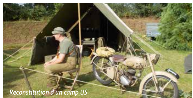
Reconstitution d'un camp US