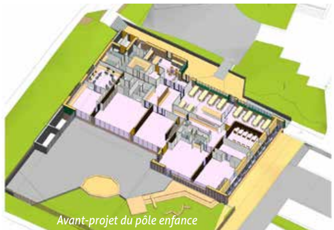
Avant-projet du pôle enfance