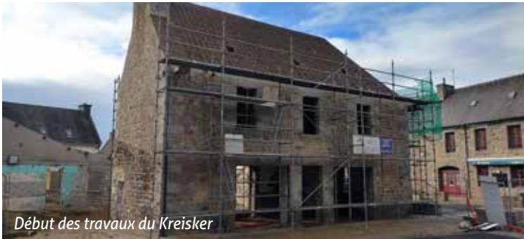
Début des travaux du Kreisker