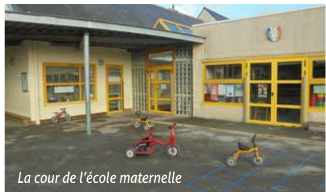
La cour de l'école maternelle

Les enfants nés en 2021 seront scolarisés en Petite Section (scolarité obligatoire). Les enfants nés en 2022 pourront être scolarisés en Toute Petite Section après la mise en place d'un projet d'accueil à l'école (scolarité non obligatoire des enfants de moins de 3 ans).