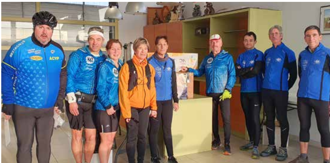
> Un don de 150 Euros a été remis par les Rederien Ploubêr

Au nom de l'AFM-Téléthon nous remercions tous les participants et donateurs.