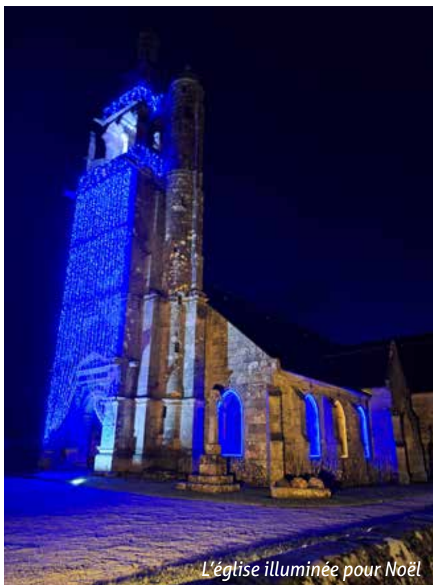
L'église illuminée pour Noël

Les mêmes principes d'infiltration par noue et pavés seront mis en œuvre pour la réfection de la rue des Blés d'Or et de la rue des Genêts, prévue début 2024.