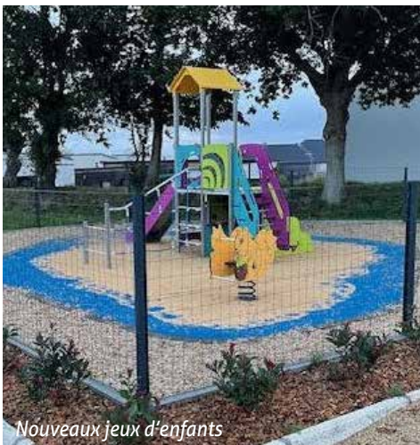
Nouveaux jeux d'enfants