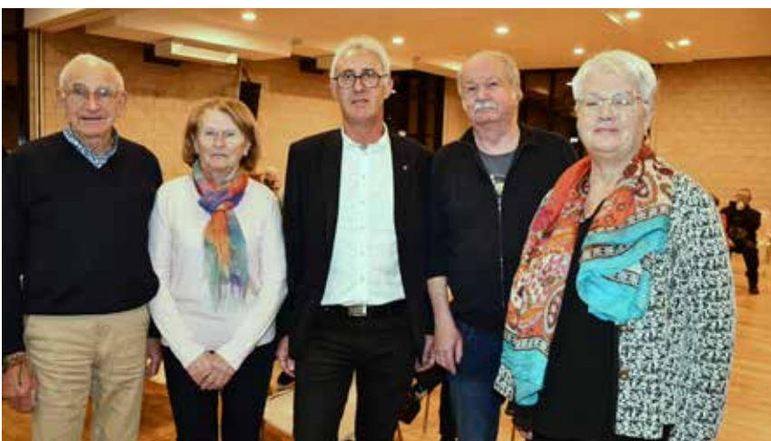
Les Membres du Bureau.

L'Assemblée Générale s'est conclue comme chaque année par un moment de convivialité autour d'un buffet apprécié par tous les participants. En 2024, l'ASELP aura 40 ans, un anniversaire que nous fêterons joyeusement. En attendant, nous vous souhaitons une très belle année 2024.