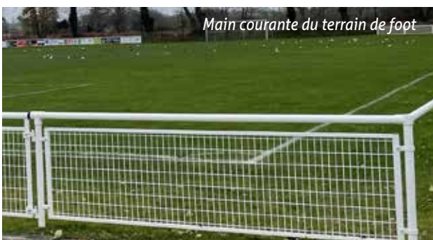
Main courante du terrain de foot