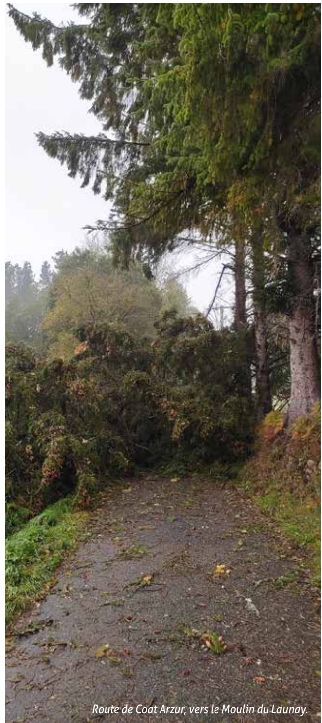
Route de Coat Arzur, vers le Moulin du Launay.

Rappelons qu'il est de la responsabilité de chaque propriétaire de veiller à ses arbres, de les élaguer préventivement si nécessaire, et de les évacuer en cas de chute accidentelle sur le domaine public.