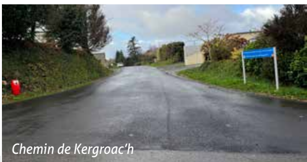
Chemin de Kergroac'h

Le chemin de Kergroac'h (430 m) a été refait en septembre dans le cadre du marché en cours avec Eurovia.