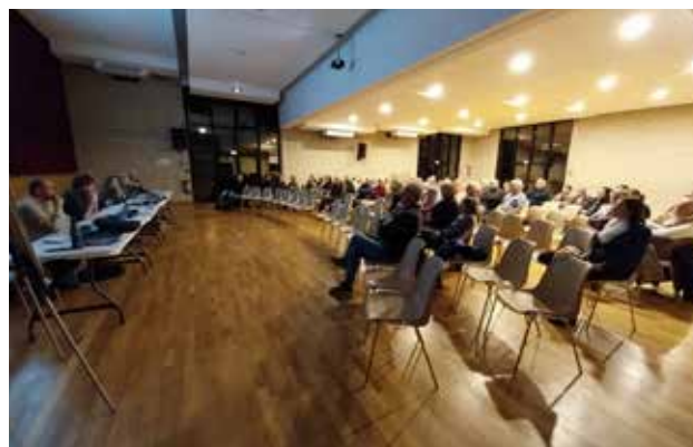
Réunion publique au CAREC sur l'aménagement du centre-bourg

Concernant le schéma de circulation, l'esquisse propose de mettre en sens unique le haut de la rue Amédée Prigent et le bas de la rue Y. Le Cudennec, ces espaces étant convertis en « zones de rencontre » des piétons, cyclistes et voitures, limitées à 20 km/h. Si la proposition de zones de rencontre a été favorablement accueillie jusque-là, l'idée d'un sens unique, en revanche, fait débat. Il faut peser les avantages et les inconvénients qu'apporterait un tel changement, en tenant compte des reports de circulation engendrés sur d'autres itinéraires. Pour cela, le Comité de pilotage a recommandé de procéder à une expérimentation préalable avec une campagne de mesure de trafic sur les différents axes concernés, avant d'aller plus avant sur cette option.