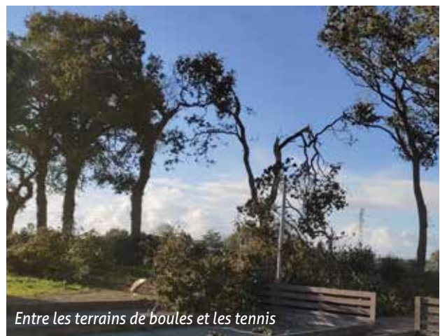
Entre les terrains de boules et les tennis