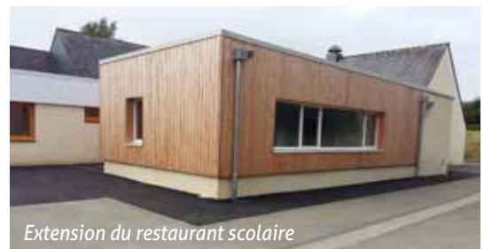
Extension du restaurant scolaire