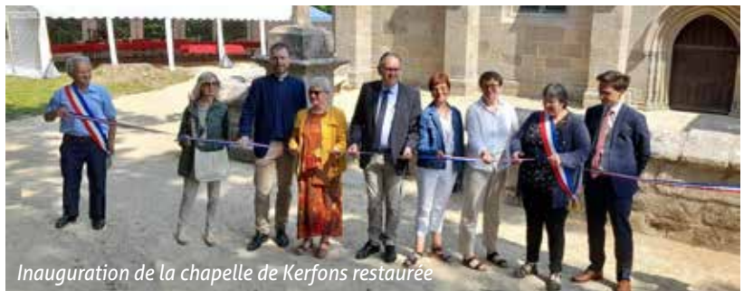
Inauguration de la chapelle de Kerfons restaurée