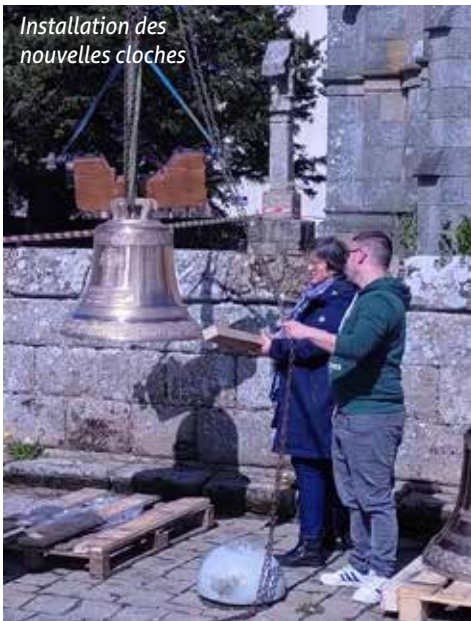
Installation des nouvelles cloches