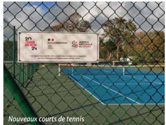
Nouveaux courts de tennis