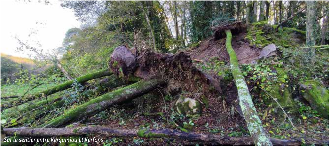
Sur le sentier entre Kerguiniou et Kerfons