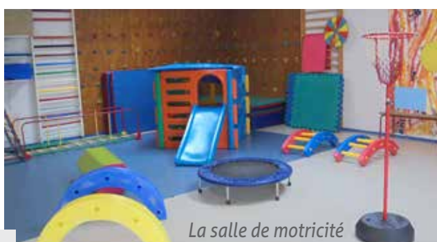
La salle de motricité