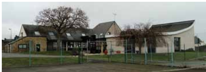
Le site des tennis, face à la longère du CAREC

Implanter le pôle périscolaire sur le site des tennis bousculerait certaines habitudes liées aux souvenirs de l'école Saint-Louis d'antan, mais, avec du recul, ce nouveau site offre des avantages objectifs : meilleure accessibilité à pied comme en voiture, parkings existants sans consommer de nouvelles surfaces, absence de nuisance pour le voisinage, proximité de la bibliothèque et des terrains de sports. Des avantages majeurs dans une vision à long terme de notre commune, pour les générations futures !