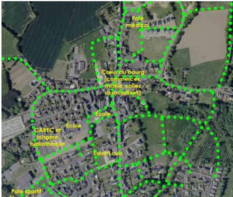
Schéma des liaisons douces structurantes à préserver, à aménager ou à créer.

Pour valoriser le cadre de vie du centre-bourg, il est proposé d'agir sur le bâti, par la mise en valeur des façades et l'harmonisation des enseignes commerciales, et sur le non-bâti, par des aménagements et l'ouverture d'une perspective visuelle et d'accès piétons vers une zone verte.