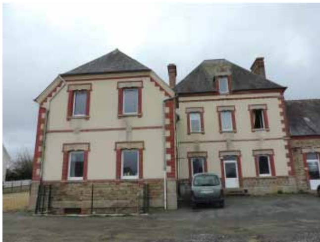
Ancienne école Saint-Louis

La création de logements s'intégrerait bien dans cette zone résidentielle, à peu de distance des commerces et des écoles.