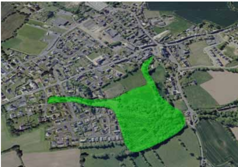
En vert le site potentiel pour une coulée verte qui pourrait être reliée à la rue Angela Duval et à la Place des Anciens combattants, sous réserve d'accord avec les propriétaires concernés.

Pour valoriser le cadre de vie du centre-bourg, il est proposé d'agir sur le bâti, par la mise en valeur des façades et l'harmonisation des enseignes commerciales, et sur le non-bâti, par des aménagements et l'ouverture d'une perspective visuelle et d'accès piétons vers une zone verte.