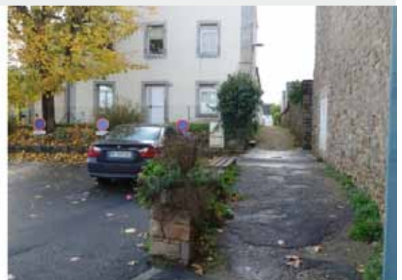
L'impasse Derriennic et le passage de la maternelle