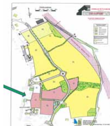
Située sur l'ilot A près du pôle médical

La commune étant à la recherche de solutions nouvelles pour accompagner les personnes âgées en perte d'autonomie, elle s'est adressée à la société « Ages & vie », pour la construction d'une résidence pour personnes âgées sur un terrain communal, proche du cabinet médical, situé dans la ZAC.