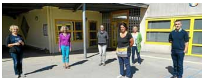
L'équipe pédagogique de l'école maternelle

Archives 2019 : rencontre sportive en élémentaire >